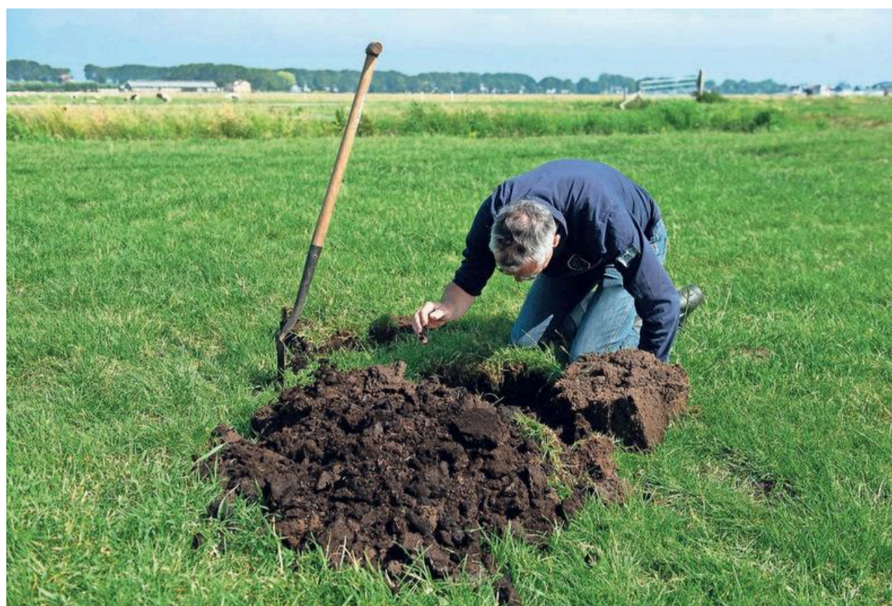
Gaten graven hoort er bij voor een bodem/watercoach.

En dat is wel eens moeilijk. Wat dat betreft heeft bodembeheer bij de boeren ook alles met waterbeheer te maken. „Ik had een stuk land waar het water bij veel regen op bleef staan. Het ging niet dieper