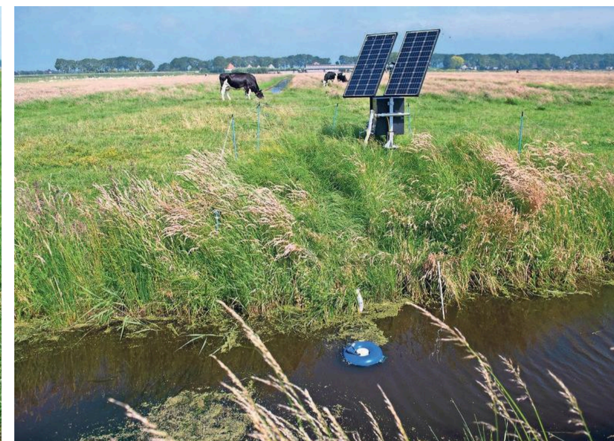
Slimme techniek zoals pompen met zonnepanelen.